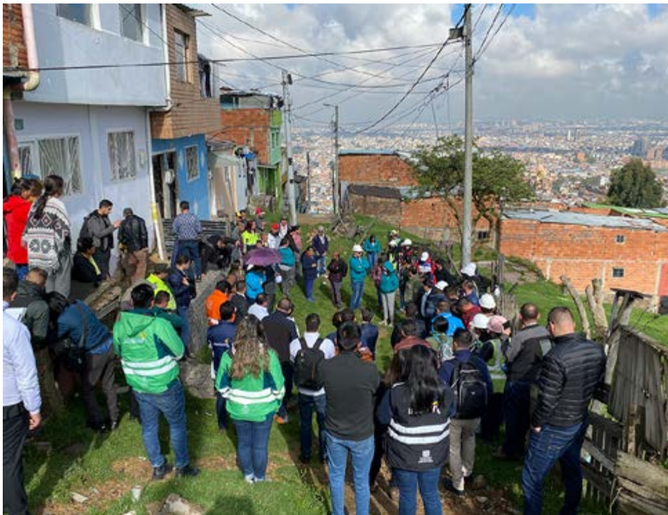
Con presencia de representantes de la comunidad, los FDL, contratistas e interventores se busca evidenciar que las obras efectivamente se ejecuten en tiempos y plazos estipulados.

Es la estrategia mediante la cual se hace seguimiento oportuno y en tiempo real a 65 obras en las 20 localidades, con el objetivo de que se concluyan y se entreguen a las comunidades. Cuando se detecte algún tipo de irregularidad o atraso considerable se incluirá dentro del ejercicio auditor y, eventualmente, pasará a la Dirección de Reacción Inmediata (DRI) de la Contraloría de Bogotá D.C. para que adelante las actuaciones pertinentes.