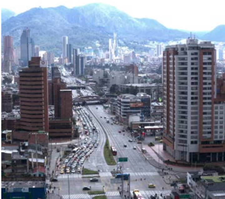
El Contralor de Bogotá dará a conocer el balance de la gestión adelantada entre noviembre de 2021 a noviembre de 2022.