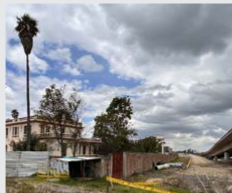
Esta es la Hacienda Villa Mejía Tagaste que estaría siendo afectada por las obras viales en Kennedy.