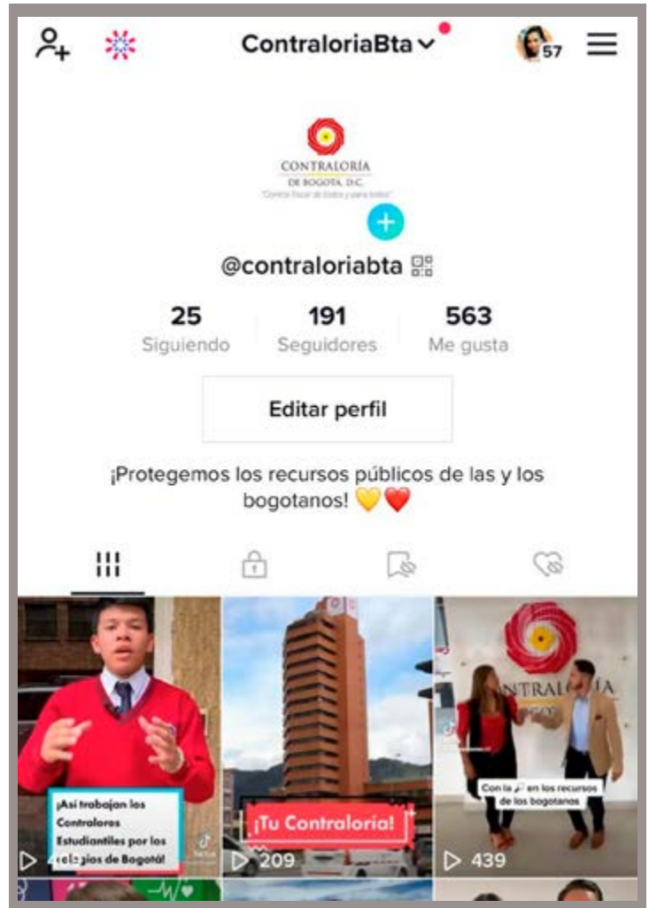
Los jóvenes son los principales usuarios de las redes sociales y con TikTok los contralores estudiantiles han sido protagonistas.

En ese objetivo, hace unas pocas semanas la Contraloría de