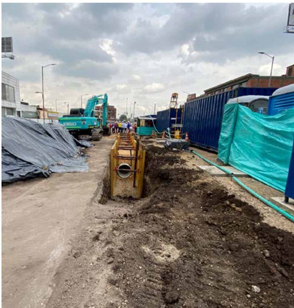
El seguimiento al proyecto de el Metro de Bogotá se realiza a través de la Dirección de Movilidad de la Contraloría, que hace registro del cronograma y de las inversiones en este macroproyecto de la ciudad.

Por último, el componente de estudios y diseños de detalle, se espera que se entreguen todos los productos a tiempo, para poder iniciar su oportuna ejecución en el 2023. Este organismo de control seguirá realizando el oportuno acompañamiento y seguimiento a este proyecto de gran importancia para la infraestructura del país.