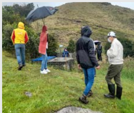
Más de 2.000 personas se benefician con los acueductos veredales Acuamarg y Aguas Doradas.

La Contraloría de Bogotá D.C., a través de la Gerencia Local, realizó visita a Usme, en el sur de la ciudad, donde se realizan obras de fortalecimiento y mejoramiento de los acueductos rurales Acuamarg y Aguas Doradas,