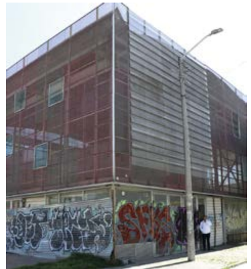
Este es un salón comunal de Kennedy, que no ha sido entregado a la comunidad.

Entre las obras objeto de vigilancia especial se encuentran intervención de la malla vial, parques, remodelación de sedes administrativas e intervención de puentes y acueductos veredales, entre otros.