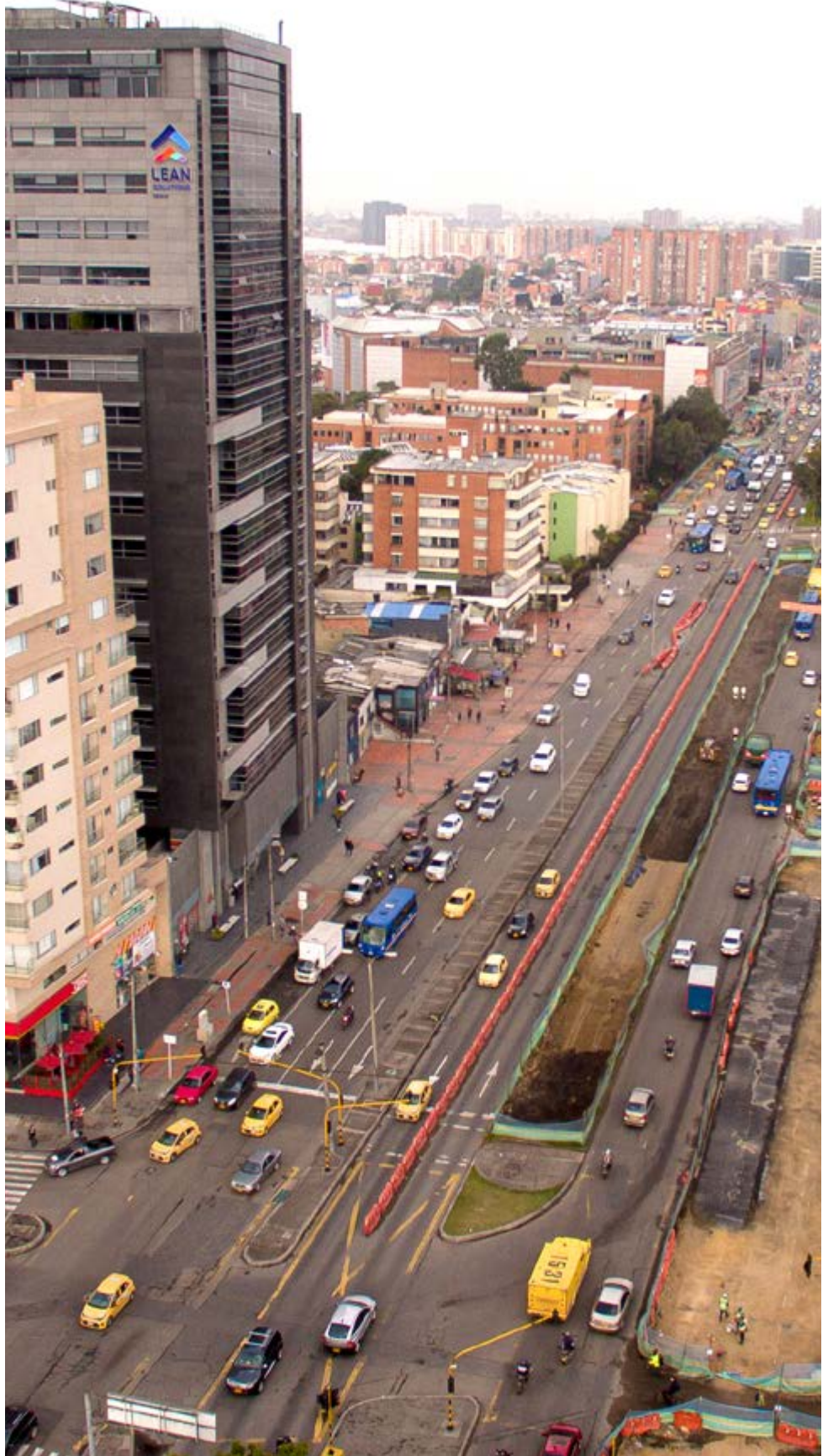
Los ciudadanos podrán hacer seguimiento de esta rendición de cuentas a través de las redes sociales.

Este evento público será transmitido por las redes sociales de la Contraloría de Bogotá Facebook: @ContraloriadeBogota y YouTube: Contraloriabta, y durante la rendición se recibirán preguntas a través del chat de la transmisión así como, a partir de ahora en el del correo rendicioncuentas@contraloriabogota.gov.co